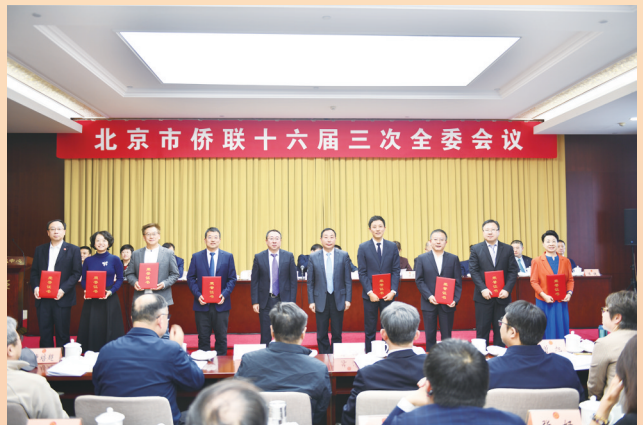
北京市侨联召开十六届三次全委会议