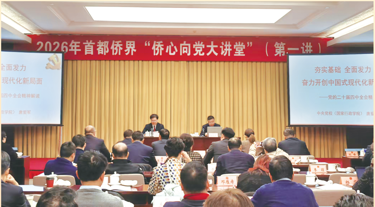
2026年首都侨界“侨心向党大讲堂”首场讲座开讲