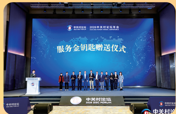
2026侨海创新发展大会成功举办